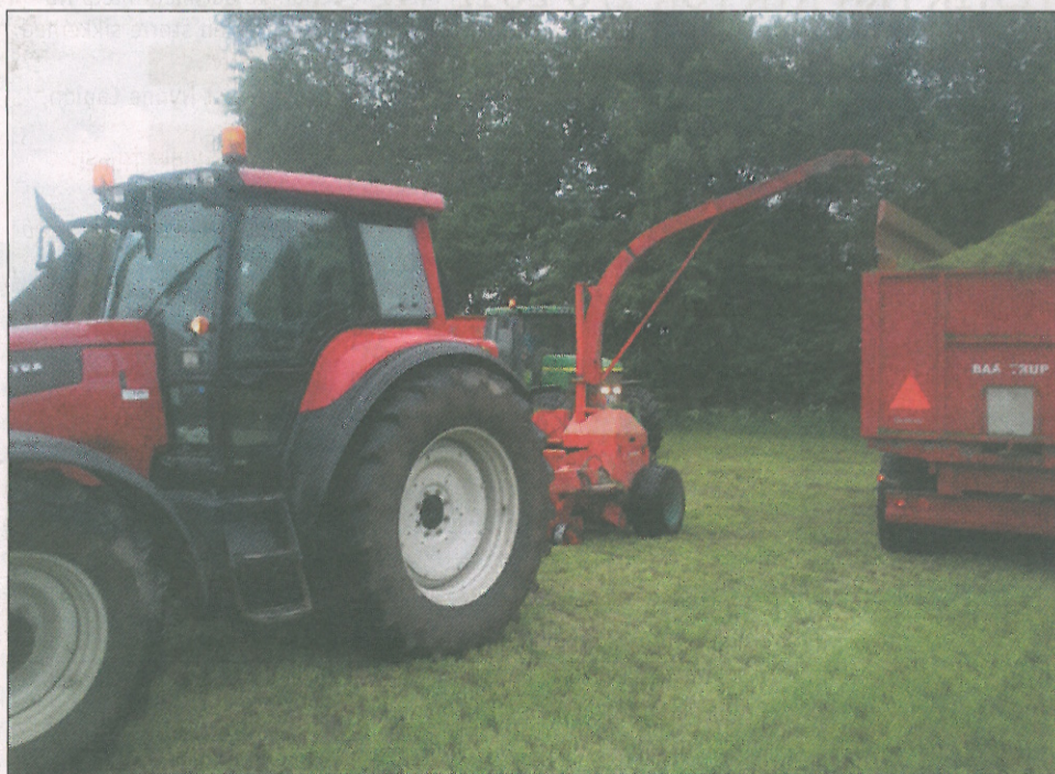
Hos Søfælde I/S snitter de selv græsset med en ældre bugseret Kverneland Ten X.